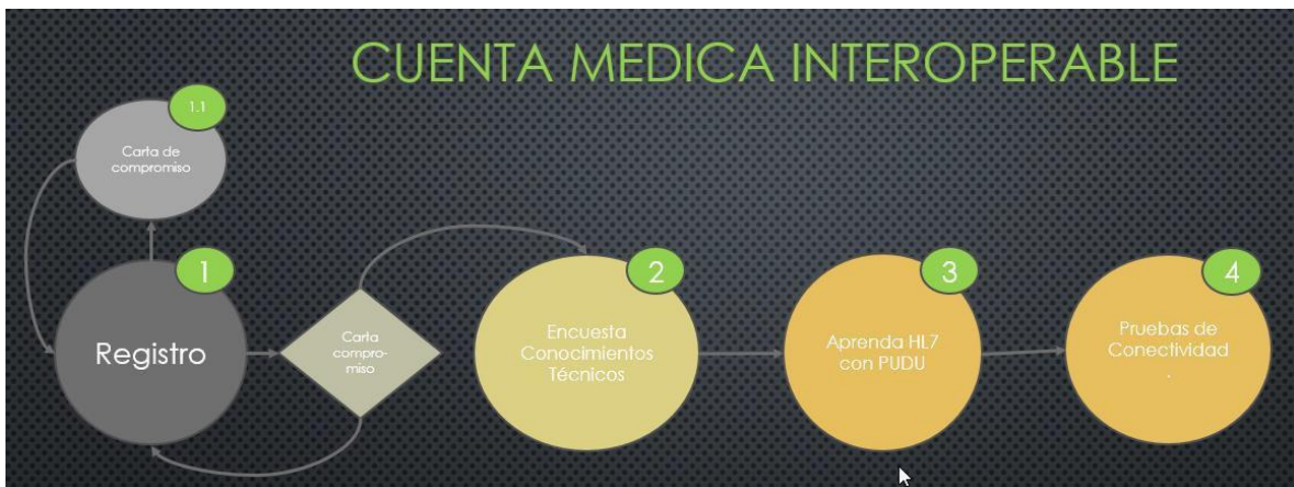
ILUSTRACIÓN 02: Paso a Paso Metodología de Incorporación

Para validar que un usuario cumple todas las condiciones para solicitar incorporarse como nuevo prestador a CMI, debe cumplir con los pasos que se muestran en la Ilustración 02.